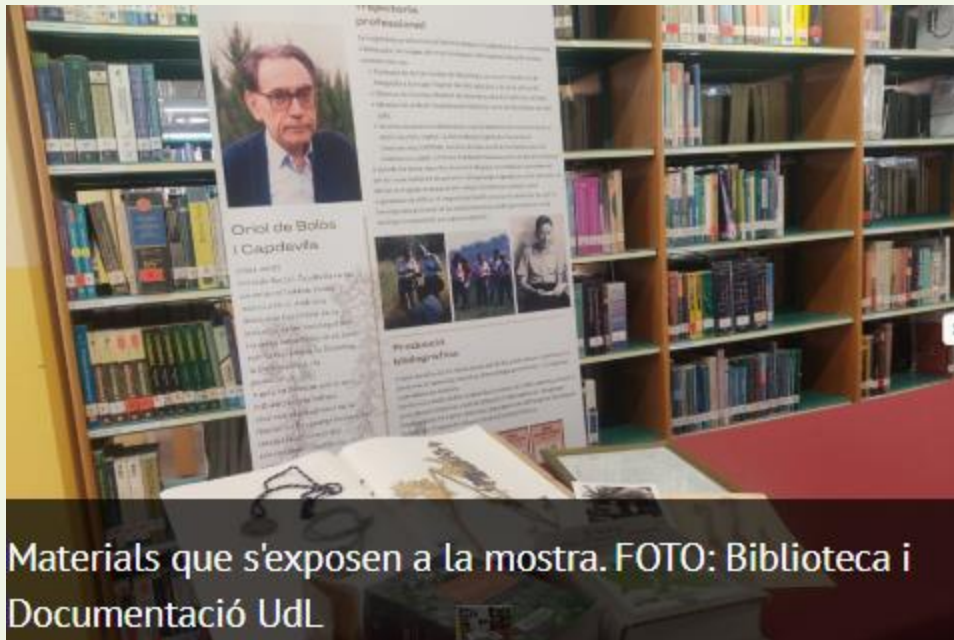
Materials que s'exposen a la mostra.