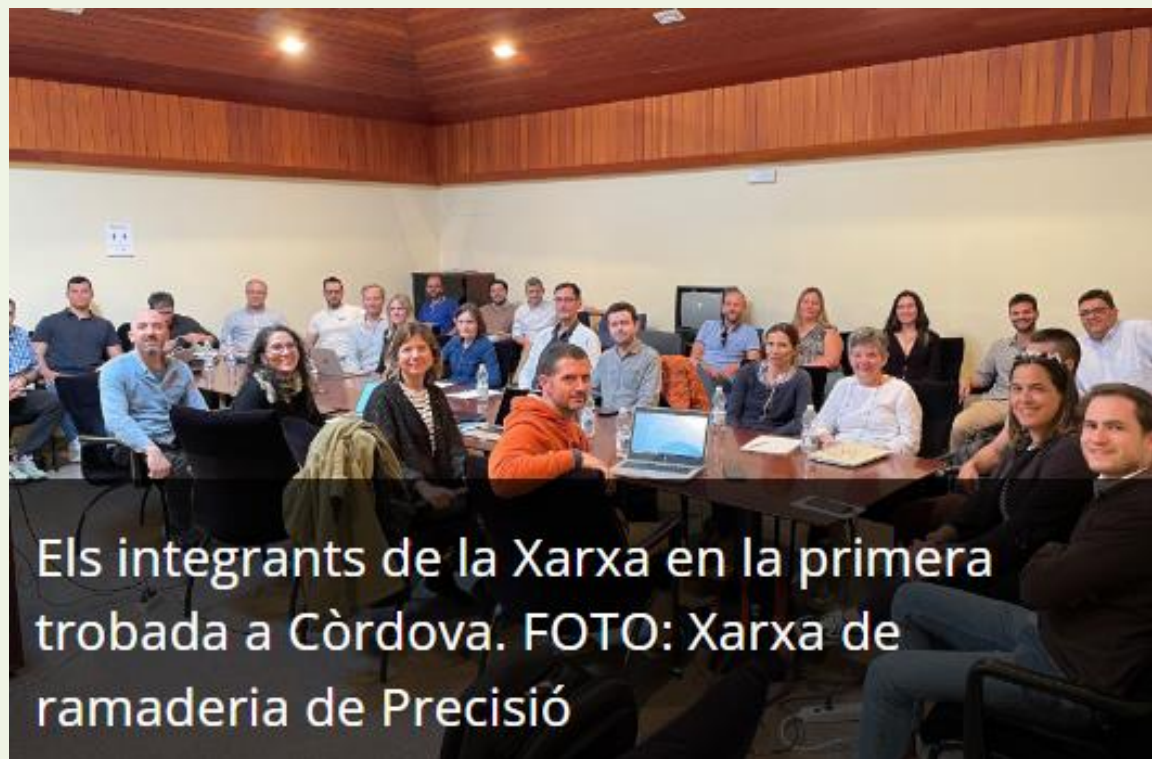
Elts integrants de la Xarxa en la primera trobada a Còrdova.