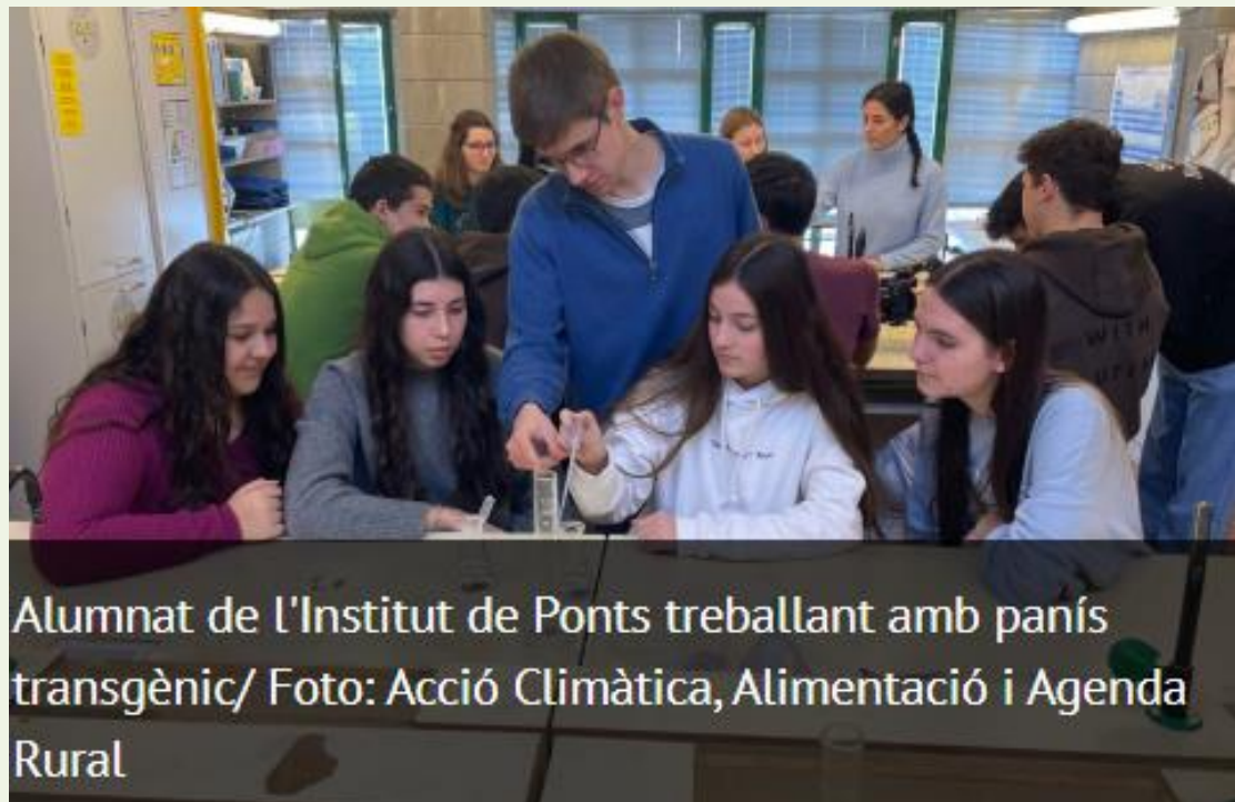
Alumnat de l'Institut de Ponts treballant amb panís transgènic

Departament d'Agricultura i Fundació Catalana per la Recerca