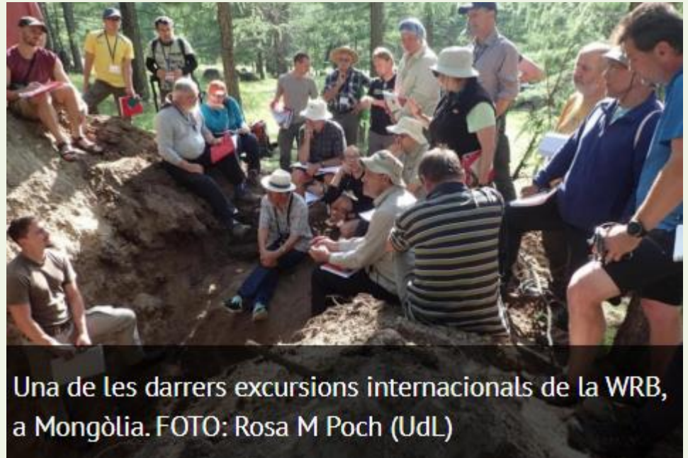
Una de les darreres excursions internacionals de la WRB, a Mongòlia.